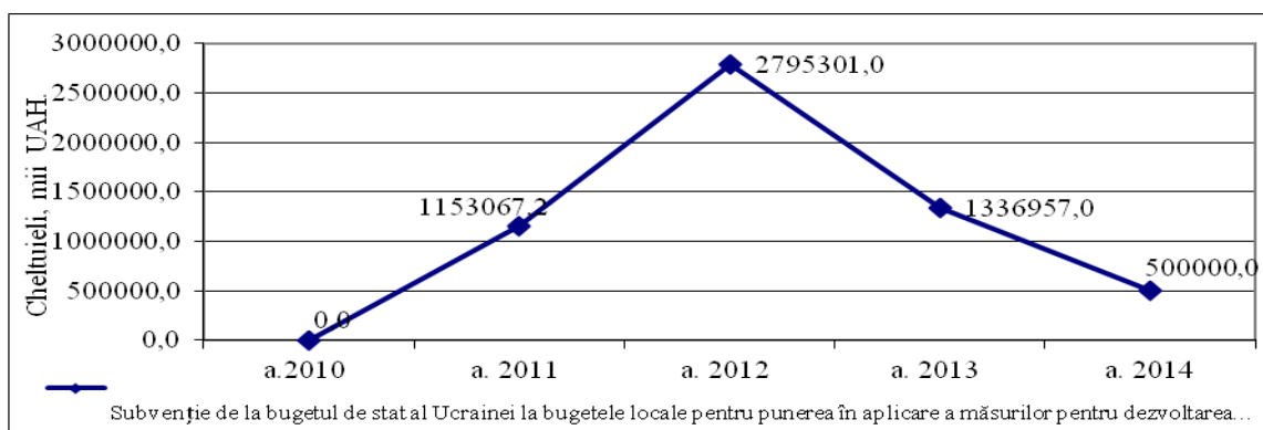
Fig. 2. Subvenții din bugetul de stat al Ucrainei la bugetele locale pentru desfășurarea măsurilor privind dezvoltarea socio-economică a teritoriilor/

Moreover, state funding is granted for the development of the social-cultural fields of some certain areas (Figure 2).