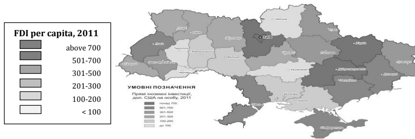
Fig.3. Investițiile străine directe în producerea de alimente în regiunile Ucrainei Fig. 3. Foreign direct investment in the food production in the regions of Ukraine